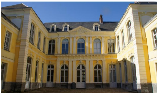
◁ l'Hôtel de Guînes

→ Le lieu / Location : Hôtel de Guînes, Arras (rue des Jongleurs)