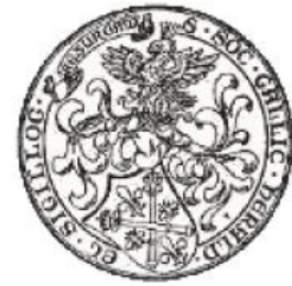
Société française d'Héraldique et de Sigillographie - SFHS