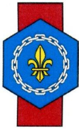
Fédération française de Généalogie - FFG