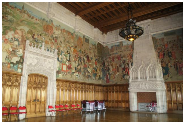
◁ L'hôtel de ville d'Arras - City Hall